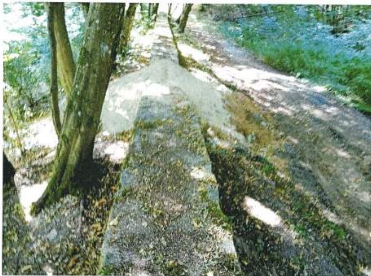
Fotografie przedstawiające istniejący kolektor, którym doprowadzane są ścieki do oczyszczalni w Rucianem-Nidzie