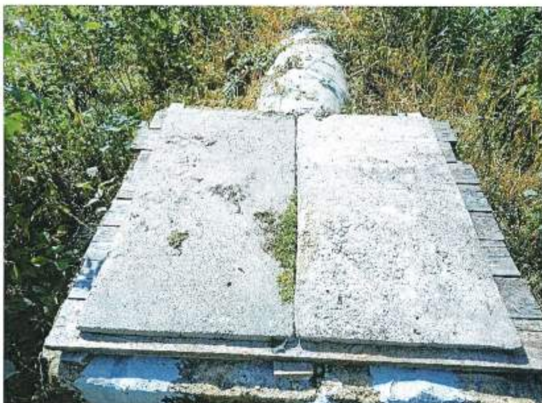
Fotografie przedstawiające istniejący kolektor, którym doprowadzane są ścieki do oczyszczalni w Rucianem-Nidzie