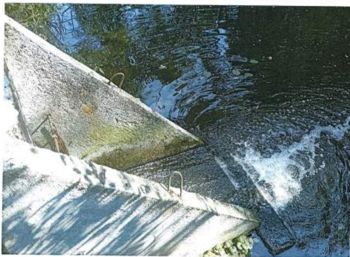
Fotografie przedstawiające filtr bębnowy oraz istniejący wylot ścieków, odprowadzający ścieki do rzeki Nidki