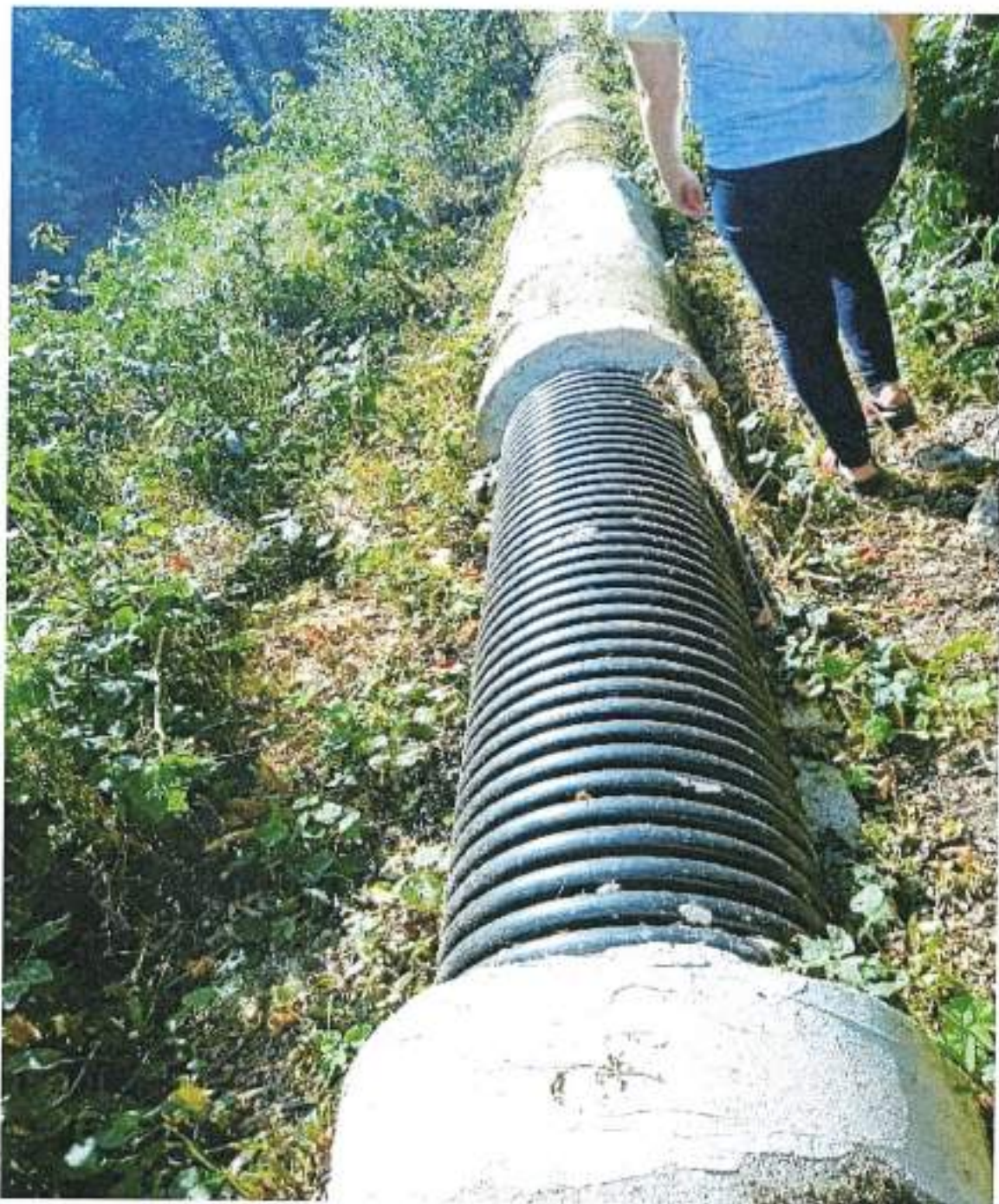
Fotografia przedstawiająca istniejący kolektor, którym doprowadzane są ścieki do oczyszczalni w Rucianem-Nidzie