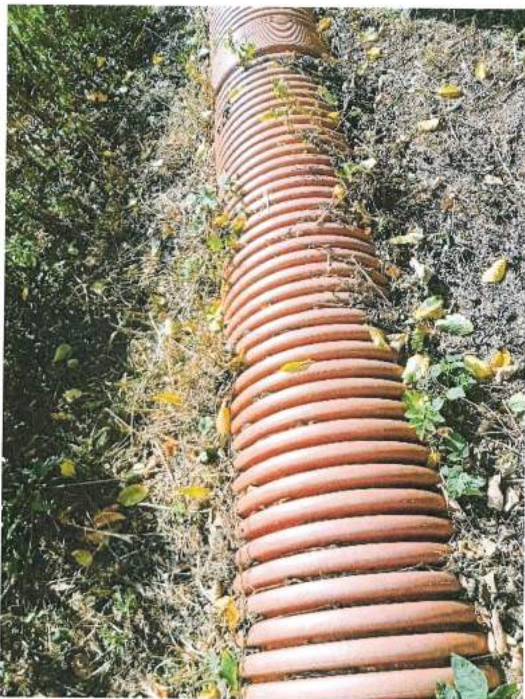
Fotografia przedstawiająca istniejący kolektor, którym doprowadzane są ścieki do oczyszczalni w Rucianem-Nidzie

Załącznik Nr 4 do notatki z oględzin z dnia 26.08.2022 r. w sprawie BI.ZUZ.3.4215.45.2022.KB